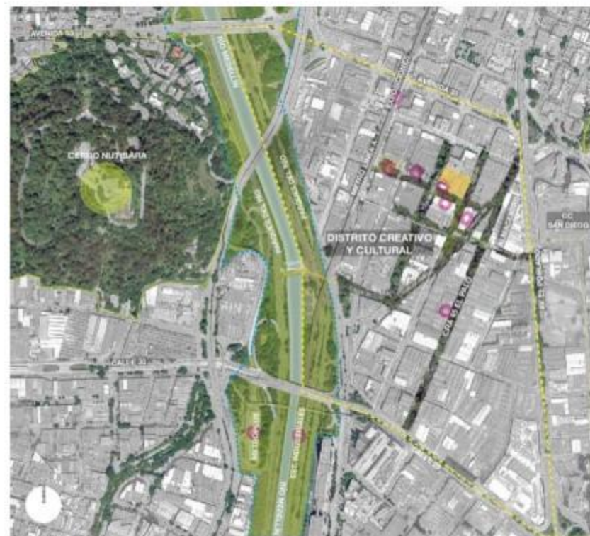
Ilustración conceptual de proyectos catalizadores priorizados para el Distrito. Elaborado por: Arq. Juan Esteban Correa, MSC